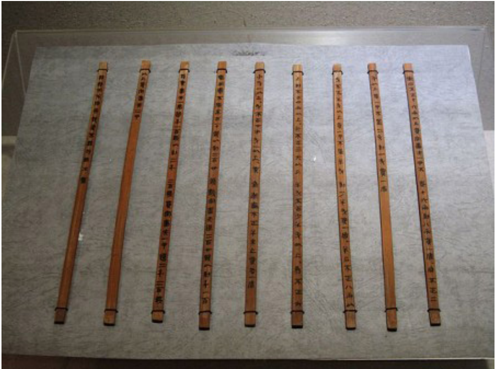
Một phần điều khoản của “Hiệu luật” trên thẻ tre đời Tần

Đến thời Xuân Thu Chiến Quốc, Đại Tần kiến lập, đạo đức nhân loại đã không thể nào sánh với đạo đức nhân loại thượng cổ được. Tần Thủy Hoàng kiến lập thể chế quốc gia đại nhất thống, tiếp tục giáo hóa con