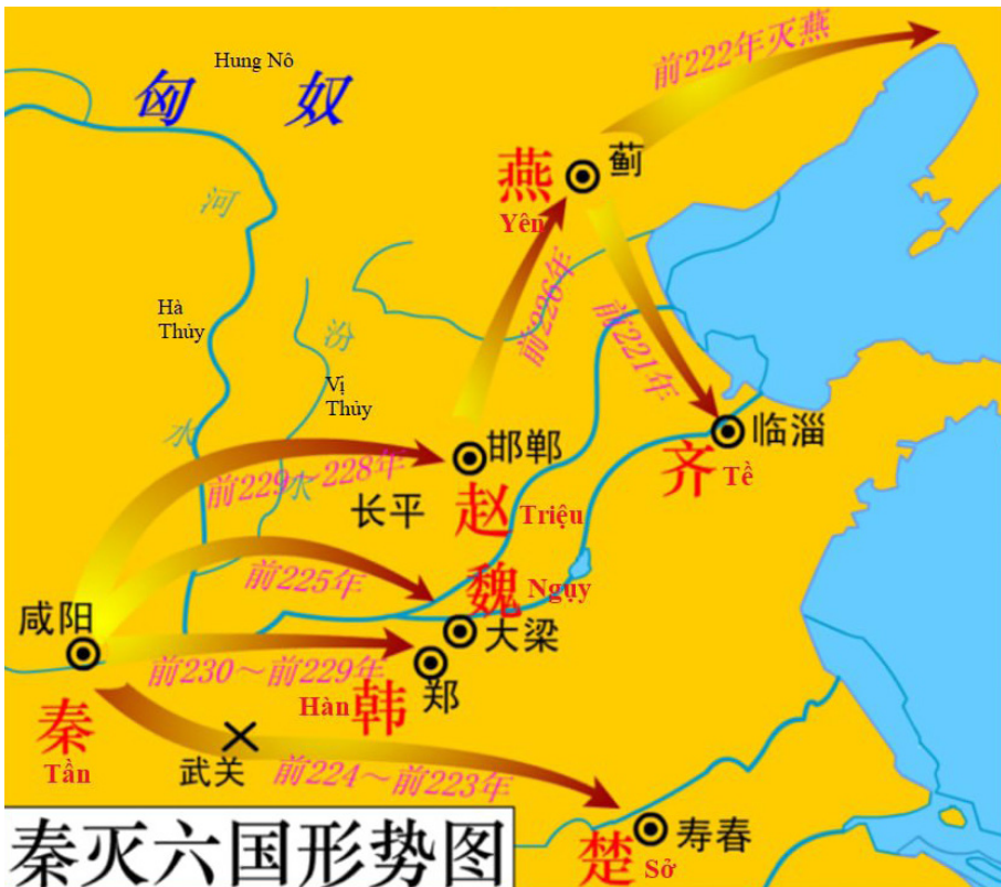
Bản đồ hình thế Tần diệt sáu nước.

thứ sáu, các nước Hàn, Ngụy, Triệu, Vệ, Sở liên thủ đánh Tần, đánh chiếm Thọ Lăng. Quân Tần xuất binh, năm nước liền bãi binh rút lui. Quân Tần đánh nước Vệ, tiến sát đến Đông quận, quân chủ nước Vệ là Giác dẫn bộ thuộc chạy về Dã Vương, nhờ thế núi hiểm trở mà giữ được vùng Hà Nội của nước Ngụy. Năm thứ bảy, Sao Chổi xuất hiện, đầu tiên ở phương Đông, và sau đó xuất hiện ở phương Bắc, đến tháng năm thì xuất hiện ở