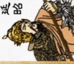
Dương Diên Chiếu