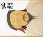
Hốt Tất Liệt