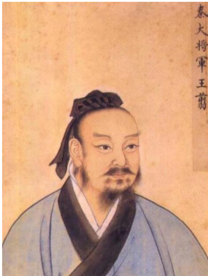
Chân dung Vương Tiễn.

231 TCN, “Giả tử” (tức quyền quận tử) Đằng của quận Nam Dương nước Hàn dâng cho nước Tần quận Nam Dương. Tần Thủy Hoàng phong cho Đằng làm Nội sử, sau đó lại phái Đằng công chiếm nước Hàn. Tần Thủy Hoàng năm thứ 17 (năm 230 TCN) bắt sống được Hàn Vương An. Nước Hàn diệt vong.