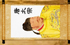
Đường Thái Tông