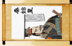
Tần Thủy Hoàng