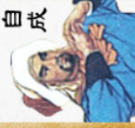
Lý Tự Thành