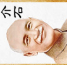
Tướng Giới Thạch