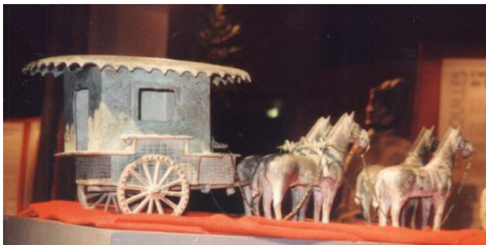
Xe ngựa bằng gốm bồi táng trong lăng mộ Tần Thủy Hoàng

Năm 1974, phía Đông mộ Tần Thủy Hoàng ở núi Ly Sơn phát hiện ra các hố tượng binh mã đời Tần, tổng diện tích hơn hai vạn mét vuông, với 7000 tượng gồm các binh sĩ cao khoảng 1.8 mét được bày thành trận, trên 700 con ngựa gốm kích thước bằng ngựa thật, 130 chiến xa. Những bảo vật của văn minh nhân loại, những tinh túy trong các lĩnh vực văn hóa, văn nghệ đều được bảo vệ an toàn dưới lòng đất hơn 2000 năm. Khi con người ngày nay khi bước vào phần lăng mộ đặt tượng các binh mã này, mới cảm thán và cảm tạ Tần Thủy Hoàng hơn 2000 năm trước đây đã để lại cho hậu thế và thế giới tài sản quý báu nhường này!