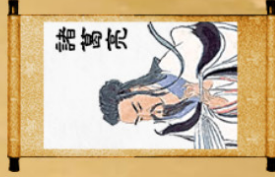
Gia Cát Lượng