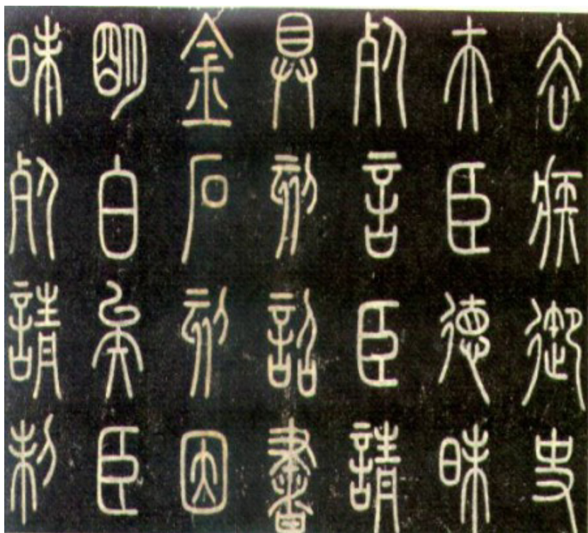
Một phần “Bia đá Lang Nha Đài” bản khắc đời Tống

nhìn trời đất, không cần nói cũng biết. Hơn nữa, xu thế tổng thể của đạo đức nhân loại là đang trượt dốc, mỗi một “Thiên cổ anh hùng” đều là thụ thiên mệnh riêng của mình. Đến thời Tần, đạo đức con người đã kém xa thời Nghiêu, Thuấn, nếu vẫn dùng cách trị vì năm xưa thì không thể có tác dụng nữa, Thủy Hoàng Đế cần phải có các biện pháp, pháp luật của hoàng triều Đại Tần trị vì thiên hạ, giáo hóa con dân. Do vậy, công tích của Tần Thủy Hoàng rất khổng lồ, ân đức rất lớn, không kém gì Tam Hoàng Ngũ Đế vậy.