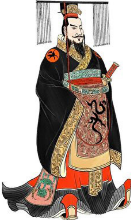
Chân dung Tần Thủy Hoàng Doanh Chính.

Toàn bộ giai đoạn lịch sử này nghiêm nhiên có vai trò tương tự như việc Đạo và Nho truyền rộng ra xã hội ở Trung Hoa, gieo mầm chính tín với Thần; Tần Thủy Hoàng, Hán Vũ Đế đã phát triển, làm rục rở thêm và bảo hộ một phiên bản của văn hóa Thần truyền.