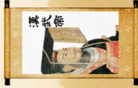
Hán Vũ Đế